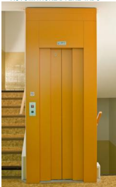
AUTOMATICKÉ DVEŘE 4ADC